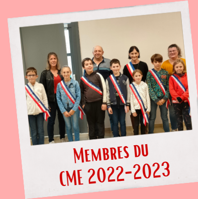
MEMBRES DU CME 2022-2023

Le lundi 17 Novembre s'est tenue la passation d'écharpes des membres du Conseil Municipal des Enfants.